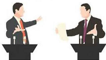
Абай Құнанбайұлы атындағы №87 мектеп-гимназиясы